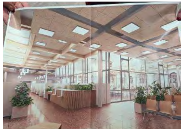
Momentaner Zustand der Arbeiten