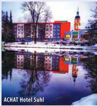
ACHAT Hotel Suhl

Das Hotel befindet sich inmitten des Stadtzentrums von Suhl im Thüringer Wald: es ist idyllisch, ruhig und direkt am Herrenteich gelegen. Das Hotel bietet 124 modern eingerichtete Zimmer mit komfortablen Betten, Telefon, TV sowie Bädern mit Dusche/WC und Haartrockner. Das Hotel verfügt über Lift, zwei Restaurants, Salons und Hotelbar. WLAN kostenfrei.