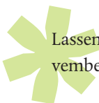
Viel Altstadtflair in Traben-Trarbach

Lassen Sie mich noch einmal auf Geschehnisse im November des vergangenen Jahres zurückkommen.