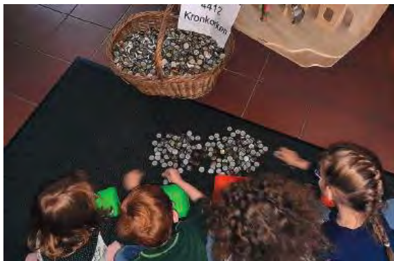
Jährliches Kronkorkensammeln steht auch auf dem Programm

Weitere regelmäßige Aktivitäten sind: die Durchführung des Nikolausmarktes, das gemeinsame Baum-schmücken mit den Kindern vor Weihnachten, die Gestaltung und die Pflege der Beete am Markt. Bei der Aussaat und Ernte helfen Kinder aus benachbarten KITAs im jährlichen Wechsel. Sie ernten neben dem Gemüse auch die Ergebnisse der Kronkorkensamm-lung aus dem gelben Sammelkästchen, das seit 2019 an der Gartenmauer am Markt hängt - mit einem Erlös von jährlich ca. 300 EUR.