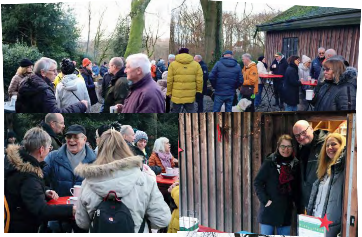
Stimmungsvolle Waldweihnachtsfeier am Waldhaus