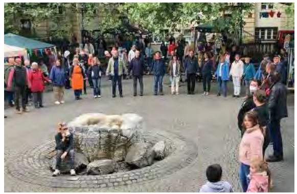
Wichlinghauser Bürgerinnen und Bürger beim gemeinschaftlichen Kreistanz

Im unregelmäßigem Abstand werden größere, aufwendigere Veranstaltungen durchgeführt: z. B. bis jetzt drei Lichterfeste an der Wichlinghauser Kirche in der Voradventszeit, zwei Musikfeste unter dem Motto „Wichlinghausen macht Musik“ (2022 und 2024). Dort konnten junge und ältere Musiker und Sänger ihr Können vor einer großen Zuhörerschaft zeigen. Eine Wiederholung im Zweijahresrhythmus ist angestrebt.