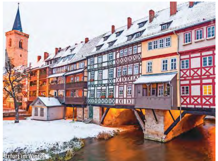
Erfurt im Winter

Nach dem Frühstück Start in den heutigen Adventstag und Fahrt in zwei der schönsten (Weihnachtsmarkt-) Städte Thüringens, beginnend mit Weimar. Hier ist die Verbindung von Geschichte und festlicher Atmosphäre allgegenwärtig: 1815 wurde hier der erste öffentliche Weihnachtsbaum Deutschlands aufgestellt und die heutige, prächtige Edeltanne auf dem Marktplatz, die das Zentrum der Weihnachtsfeierlichkeiten bildet, leuchtet im Lichterglanz und hat etwas Magisches – vor allem mit der historischen Kulisse im Hintergrund. Glühweinhütten und Imbissstände sorgen für das leibliche Wohl. Weiterfahrt nach Erfurt, der Landeshauptstadt Thüringens. Bei einer Stadtbesichtigung erleben Sie die sehenswerte Altstadt mit dem berühmten Erfurter Dom, der Krämerbrücke und den historischen Bürgerhäusern. Die Stadt erstrahlt in weihnachtlichem Glanz, und der Duft von gebrannten Mandeln und Glühwein liegt auch hier in der Luft. Besuch des traditionellen Erfurter Weihnachtsmarktes mit romantischer Atmosphäre und festlich geschmückten Buden und