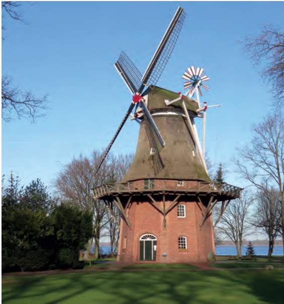
Die Kappenwindmühle im Kurpark von Bad Zwischenahn