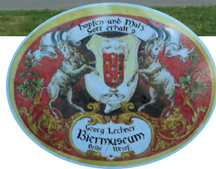
Einblicke in die Braukunst bietet das Biermuseum

sernen“ Betrieb, überall gibt es Erläuterungen für den Besucher, so dass man auch eigenständig eine Besichtigung vornehmen kann. Ein Informationsfilm geht begleitend einher. Die Geschichte des Bieres wird im Biermuseum lebendig gehalten, ein Rundgang öffnet den Blick in die Vergangenheit. Nach soviel „Tagesar-