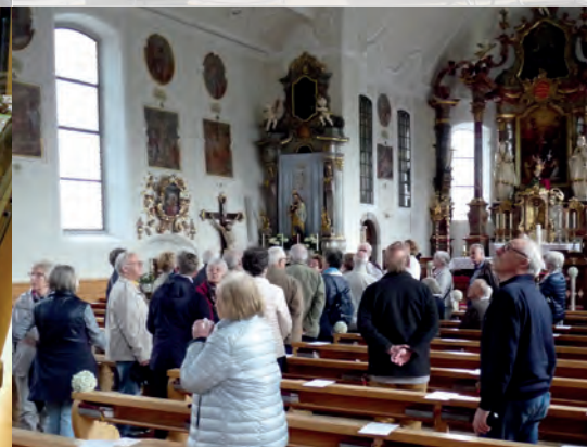
Barocke Kirche in Schwarzenberg