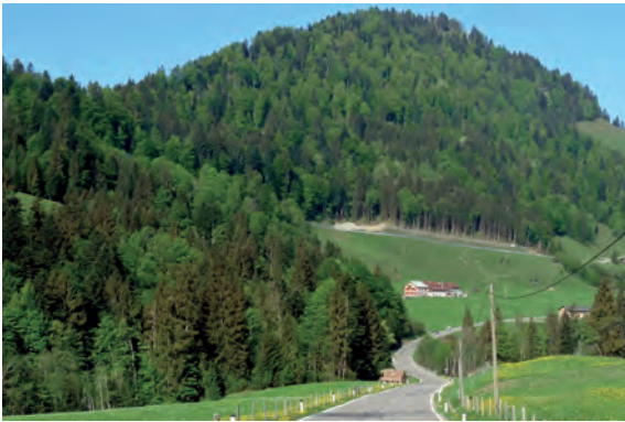
Erste Ahnung von den Alpen – Ausblick auf das Allgäu

Dienstag, 01. Mai 2018 , heute mal schon um 07.00 Uhr, ist doch die Anfahrt diesmal etwas länger, auch das Gepäck der 43 Teilnehmer umfangreicher, aber alles im Griff, es geht los, Richtung Balderschwang. Der NBV lädt anlässlich seines 125-jährigen Jubiläums zu einer Mehrtagesfahrt ein.