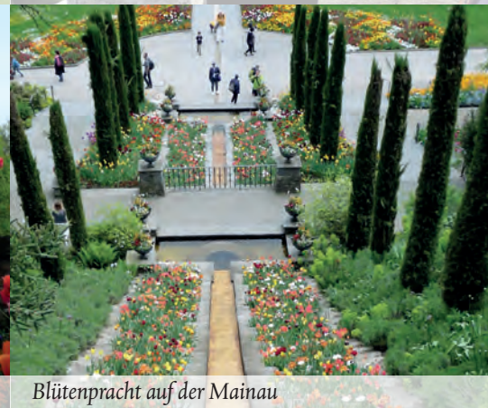
Blütenpracht auf der Mainau