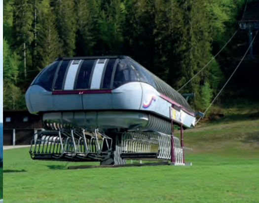
Futuristische Verkehrsmittel in Balderschwang