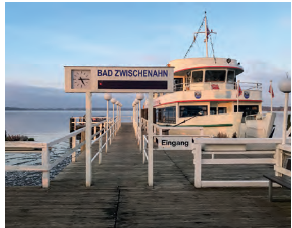
Schiffahrt auf dem Bad Zwischenahner Meer