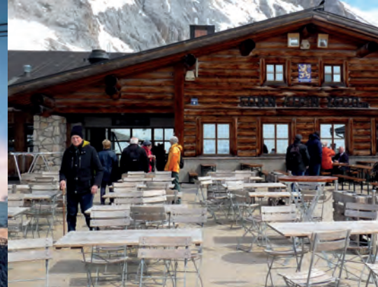
Auf der Zugspitze