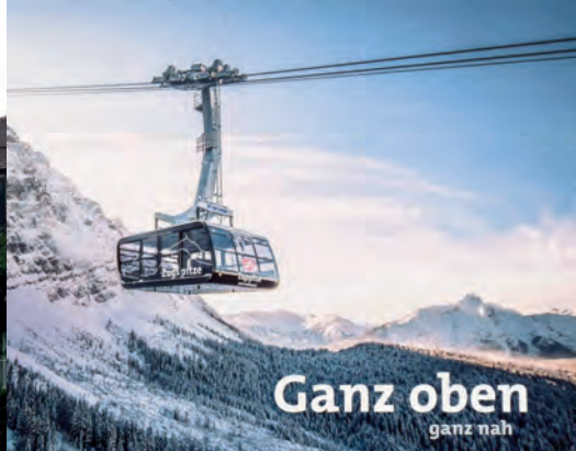
Eine Anregung für Wuppertal?