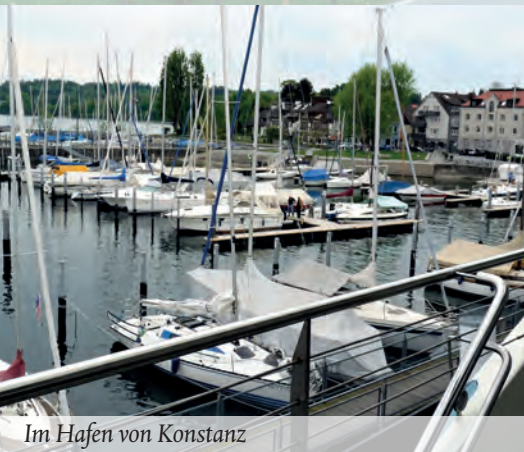
Im Hafen von Konstanz