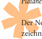
Platanenallee und blühende Rhododendronpflanzung im Nordpark

Der Nordpark erfährt in Kürze eine besondere Auszeichnung. Die Parkanlage wird aufgenommen in das Europäische Gartennetzwerk EGHN. Die offizielle Aufnahme in einem würdigen Rahmen wird voraus-