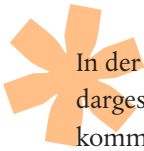
Feierliche Eröffnung in kleinem Kreis

In der letzten Ausgabe haben wir bereits ausführlich dargestellt, wie dieser Kinderspielplatz zustande gekommen ist. Die Finanzierung wurde durch eine Erbschaft, durch Mittel des Vereins und mit finanzieller Unterstützung der Bezirksvertretung Barmen sowie einer Spende der bauausführenden Firma sichergestellt.