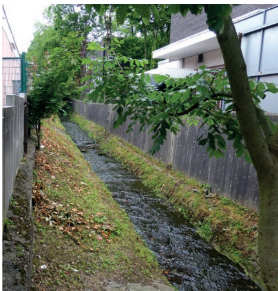
Schon lange begradigt und nicht mehr in seinem natürlichen Bett – der Leimbach