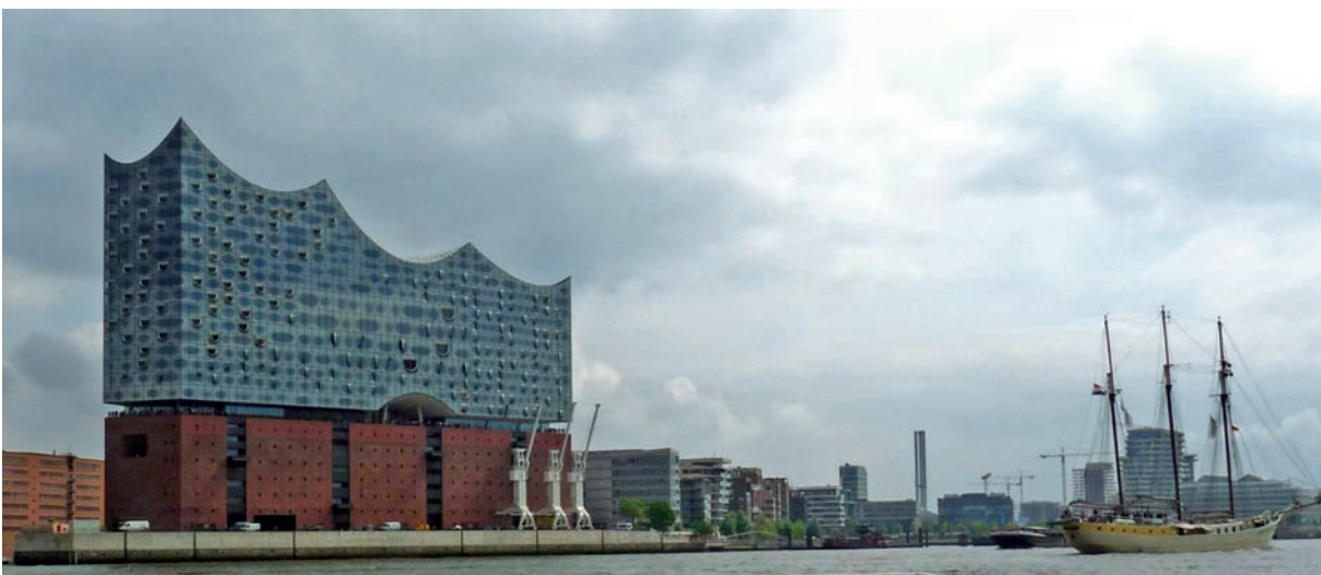
Hamburgs neue Architektur-Ikone, die Elbphilharmonie