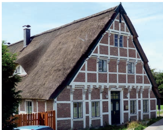
Typisches Fachwerkhaus im Alten Land

Der Turm steht getrennt vom Kirchengebäude, schwingt er doch sehr stark beim Läuten, auch eine Folge des Marschbodens. Die Fahrt geht weiter, vorbei an jahrhundertealten Fachwerkhäusern mit Ziegelfronten und weiß gekälkten Balken, natürlich reetgedeckt. Wir hören beiläufig, nur allein ein solches Dach hat den Gegenwert eines Einfamilienhauses, die Lebensdauer – nicht mehr als eine Generation! Auch ein Hingucker, die verschiedensten, den jeweiligen Stilepochen entsprechenden Haustüren, reich geschnitzt oder mit Glaselementen versehen. Zwischen den Orten die Obstplantagen, Reihe an Reihe stehen niedrig gehaltenen Obstbäume. Die geringe Höhe kommt der Erntearbeit entgegen, die Pflanzen haben eine Nutzungsdauer von ca. 15 Jahren, „Altländer Obst“ gilt als Wertbegriff. Um übers ganze Jahr die Märkte bedienen zu können, werden die Äpfel in großen Hallen eingela-