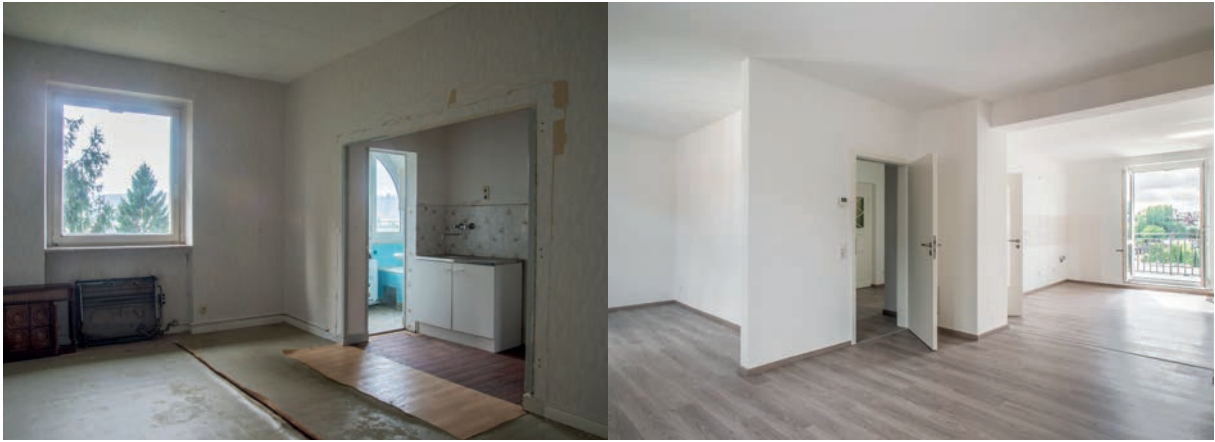
Das völlige Entkernen und Sanieren machen nun ein Wohnen im Denkmal auf modernstem Standard möglich