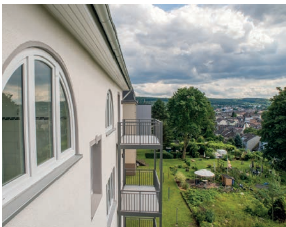
Rückansicht mit Balkon und Garten

Allerdings blieb trotzdem im Inneren des Hauses kaum ein Stein auf dem anderen. Es wurde komplett entkernt. Aus ehemals zehn wurden acht, jetzt lichtdurchflutete Wohnungen – in der dritten Etage begeisterten schon bei den ersten Besichtigungen zwei Maisonettewohnungen die Besucher. Sie bieten über zwei Etagen und jeweils gut 100 Quadratmetern genug Platz für Familien. Gleichzeitig sorgen barrierefreie Zugänge zu den beiden 55-Quadratmeter-Wohnungen im Erdgeschoss dafür, dass sich auch Mieter an dieser Adresse wohlfühlen können, die in ihrer Mobilität eingeschränkt sind. Die Rampe an der Haustür ist ein sichtbares Zeichen für den Abbau von Barrieren. Auf der Wunschliste für das Vorzeigobjekt stand natürlich diesbezüglich auch ein Aufzug. Allerdings stellte sich schnell heraus, dass sowohl die technischen Voraussetzungen als auch die Berücksichtigung des Denkmalschutzes den Einbau sehr erschweren würden. Außerdem waren die zusätzlichen Kosten so hoch, dass sich ein solcher Aufzug wirtschaftlich nicht vertreten ließ. Daher wurde bewusst kein Aufzug nachgerüstet. Auch diese Entscheidung zeigt, dass der Modellcharakter aus dem Anspruch heraus entsteht, die Nachahmung der Modernisierung zu ermöglichen.