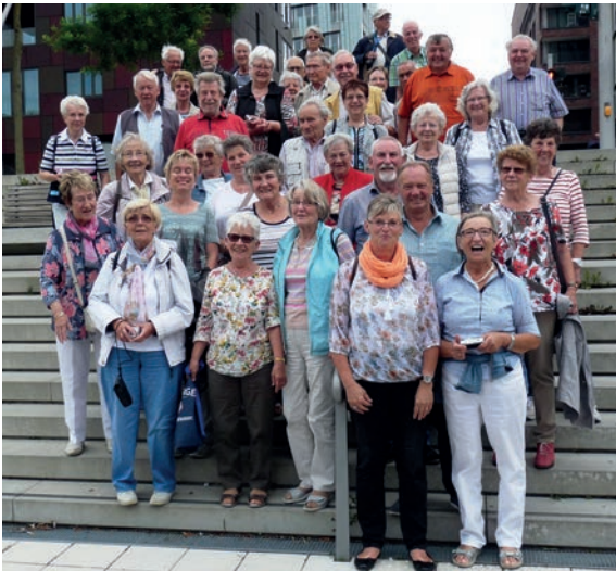
„Gruppenbild mit Treppe“

penbild mit Treppe'. Das Museum ist noch jung an Jahren, dank vieler Sponsoren und engagierter Hamburger See- und Kaufleuten jedoch schon mit großer Bedeutung. Über 10 Etagen – pardon, Decks natürlich – wird alles das dargestellt, was überhaupt mit dem Seewesen in Verbindung gebracht werden kann. Hier einzelne Bereiche hervorzuheben würde bedeuten, die anderen herabzustufen, die vielfältige thematische Gliederung spricht für sich. Wen es interessiert, allein für diesen Programmpunkt lohnt eine Fahrt nach Hamburg. Unsere Stunde vor Ort ist im Flug vergangen, wir haben nur einen Bruchteil sehen können.