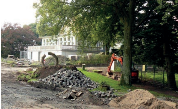
Momentan ist viel in Bewegung im Nordpark