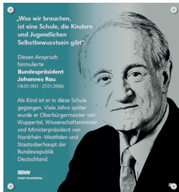
Die Erinnerungstafel zum Gedenken an Johannes Rau.

steht als Zitat auf der Gedenktafel neben einem Fotoportrait von Rau. Zur feierlichen Enthüllung durch