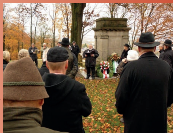
Feierliches Gedenken am Ehrenmal im Nordpark.