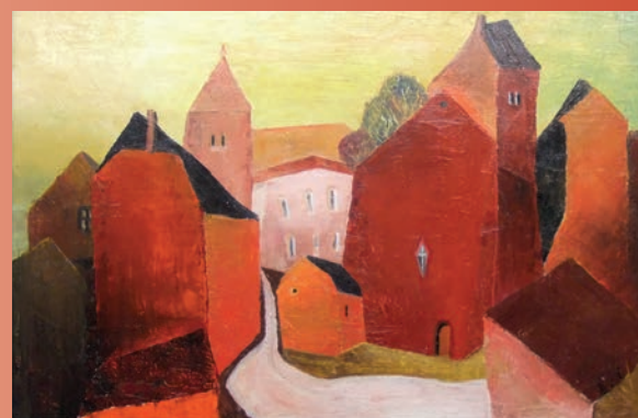
Ein Werk des Künstlers Richard Weiffenbach anlässlich des 10-jährigen Bestehens des KI Art-Cafés