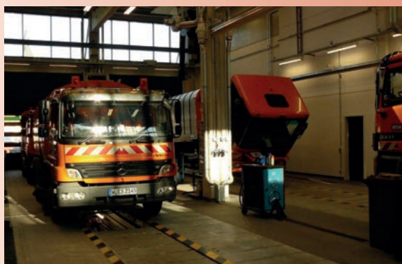
Innenansicht des neuen ESW-Werkstattkomplexes