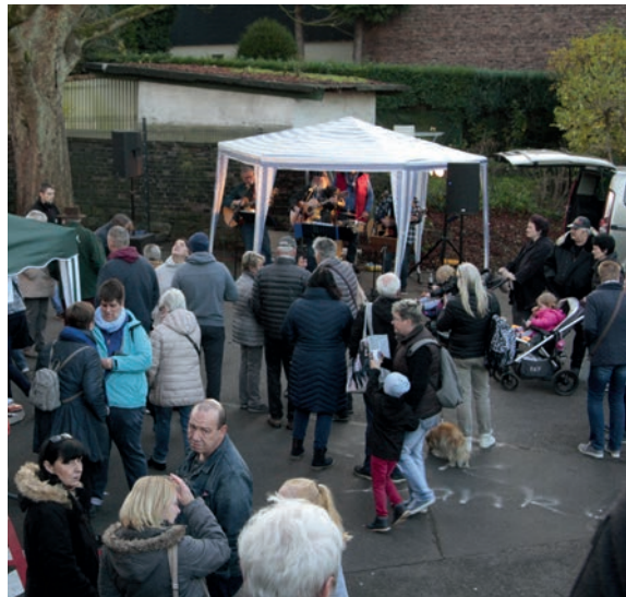
An den vielen Ständen herrschte reger Andrang.