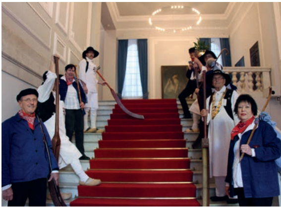
Großes Empfangskomitee zum Festakt in der Gesellschaft Concordia