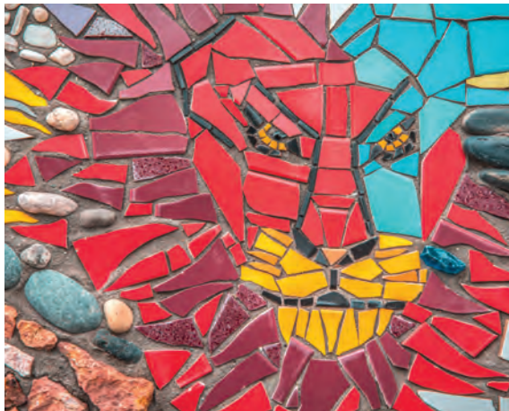
Bergische Fotosafari pur – Mosaikarbeiten an der Langbaradenstraße in Oberbarmen