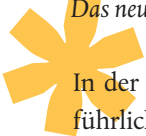
Das neue Hinweisschild an der Schützenstraße

In der Ausgabe 3/17 des Nordparkechos wurde ausführlich über die Hintergründe dieser Aktion mit Bürgervereinen und dem Wupperverband berichtet. 2017 erfolgte die Aufstellung „unseres Schildes“ an der Schützenstraße neben der Fahrschule Habbecke. Vorangegangen waren intensive Recherchen über den Verlauf des Gewässers sowie über einige geschichtliche Hintergründe. Der Wupperverband hatte die Herstellung des ansprechenden Schildes sowie die Aufstellung übernommen.