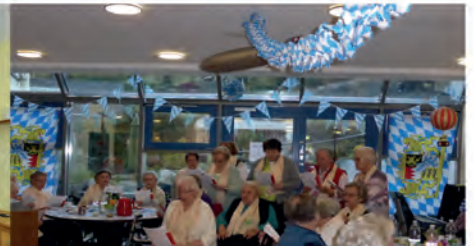
Der festina lente-Chor

Bei unseren Festen und Veranstaltungen werden wir von den ehrenamtlichen Mitgliedern der Selbsthilfegruppe „Labyrinth“ ( www.labyrinth-shg.de ), die sich um Angehörige von Demenzkranken kümmert, unterstützt.