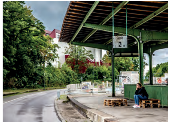
„Wartende“ am Bahnhof Wichlinghausen

gemachte Seife verschenkte. Schließlich der Bahnhof Wichlinghausen, der so viel Gelegenheit bot, unter Anleitung des Fotografen Alex Möhring, Bilder von vergeblich wartenden Menschen zu machen.